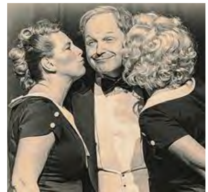
Die Dissonanten laden zur musikalischen Zeitreise.